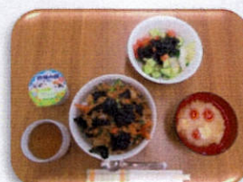
韓国風肉みそどんぶり